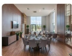
Зал "Малый Донской"