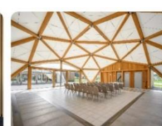
Шатры для мероприятий